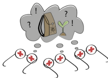
Forskningsprogrammet Aalborg Universitetshospital