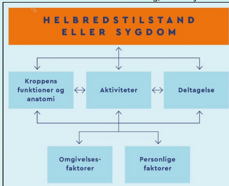
FIGUR 2 International Classification of Functioning, Disability and Health (ICF) (7)

Komponenterne i ICF er yderligt opdelt i kapitler, der igen er opdelt i kategorier. Til kroppens anatomi hører f.eks. kapitler om Kredsløb, immunsystem og respirationsystem, Fordøjelses-, stofskifte- og hormonsystemer, urin- og kønsorganer, bevægeapparatet, hud og tilhørende strukturer m.fl. (7).